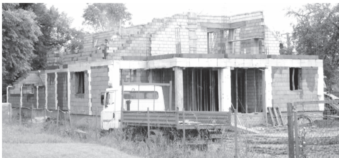
Látványosan emelkednek a falak és a remény: hamarosan új értékeket hordozó, korszerű épület fog itt állni.

Az új épület befedése után a belső munkálatokkal párhuzamosan elkezdik a területrendezést is: az ülepítő kialakítása, játszópark építése, az új kerítés felhúzása mind területet igényel, ezért a volt felekezeti iskola épületét nemsokára lebontják, erre már beszerették az engedélyeket is. „Egy élettér újul meg általa, hogy ez az óvoda-bölcsőde felépül” – összegzi a lelkész a folyamatot.