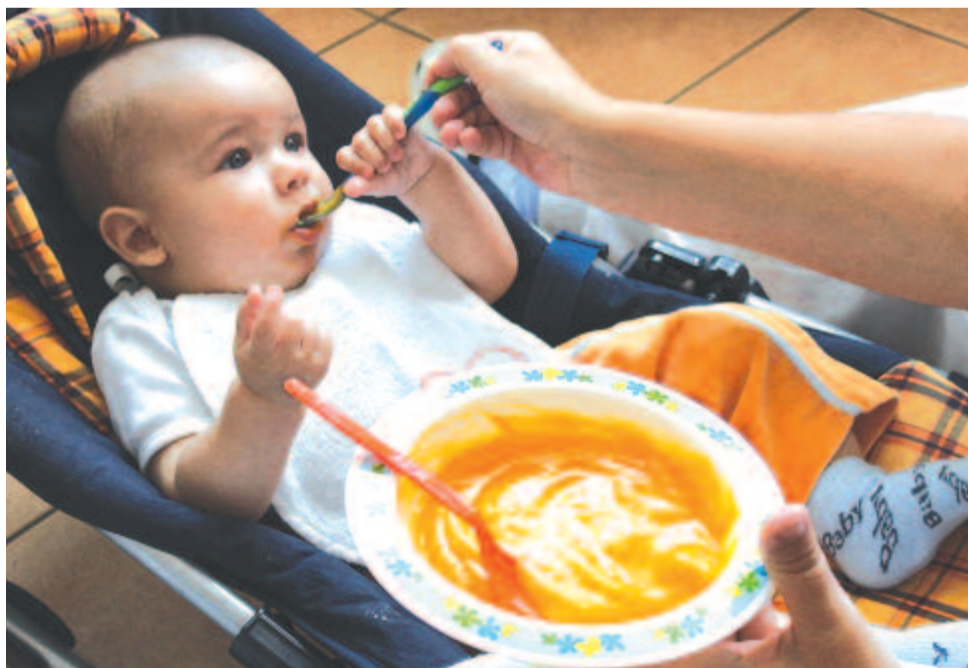
Finom a sárgarépa-főzelék